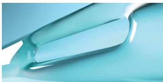
Orifícios radiais, polidos e lubrificados

reflete em minimizar o atrito uretral, com isso menor risco de trauma e hematúria, garantindo o maior nível de conforto para o paciente durante a inserção e retirada, enquanto também reduz o risco de complicações do trato urinário, além de maior conveniência para o usuário: