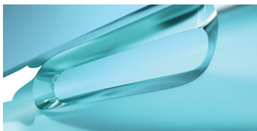
Orifícios biselados, não polidos e não lubrificados (aumento do risco de lesão uretral e hematúria)

Além disso, a composição do material do cateter é fundamental uma vez que alguns componentes causam impacto direto na saúde do usuário e também no meio ambiente. O material poliuretano, livre de PVC e ftalatos, apresenta um nível melhor de firmeza em comparação com outros cateteres de diferentes composições.