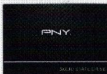
CS900 TLC Solid State Drive