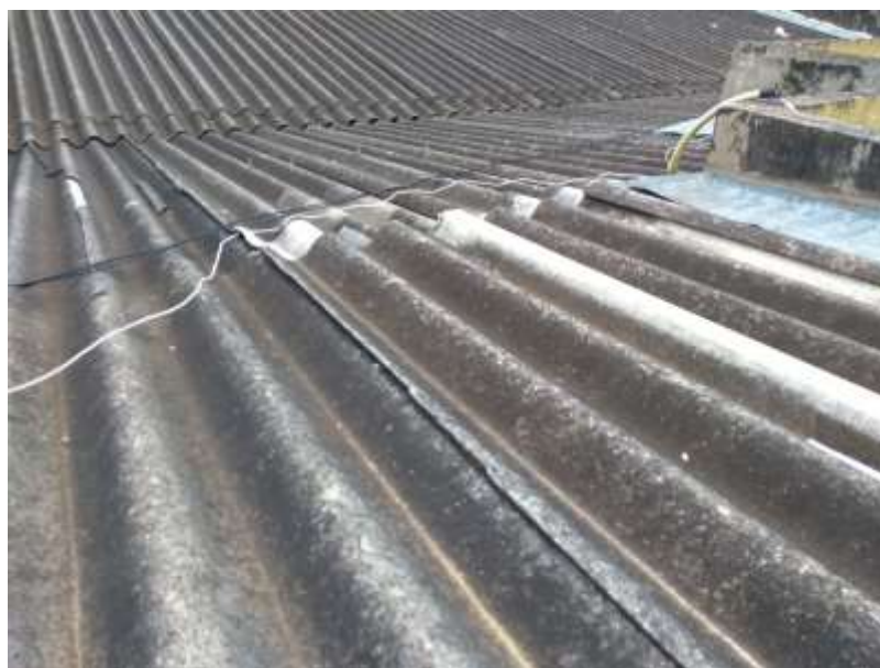
Figura 2 - Telhado 02