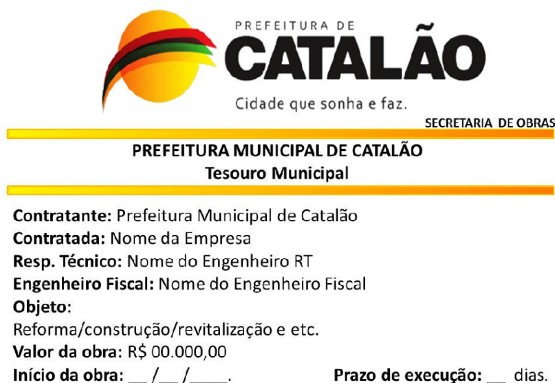
Figura 2 - Modelo da Placa de Obra - Padrão municipal

Antes de qualquer serviço orçado recomenda-se a instalação da placa de obra, nesta estarão contidas todas as informações pertinentes da obra, a mesma deverá ser de acordo com o modelo estipulado como padrão municipal. Terá dimensões de 2,00 x 1,50m.