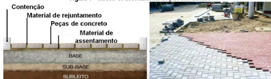
Figura 4 – Modelo de assentamento de piso intertravado

As calçadas deverão ter sua inclinação transversal de no máximo 5%, partindo da guia em direção à praça. Deverão ser aplicados, caso exista, nos pontos de ônibus e em volta dos grupos de orelhões, o piso tátil de alerta em ladrilho hidráulico, na cor amarelo, medindo 25x25x2cm, de acordo com a determinação da Norma ABNT NBR 9050/2004.