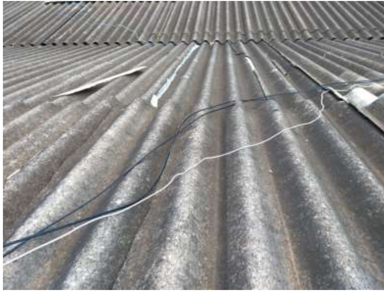
Figura 1 - Telhado 01