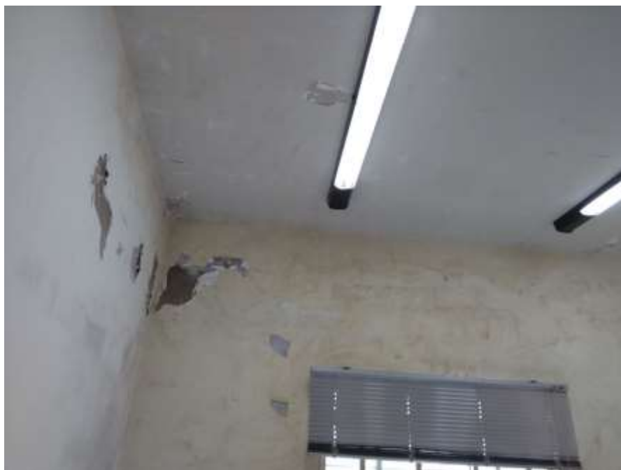
Figura 5 - Pintura 01