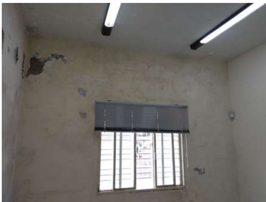
Figura 6 - Pintura 02