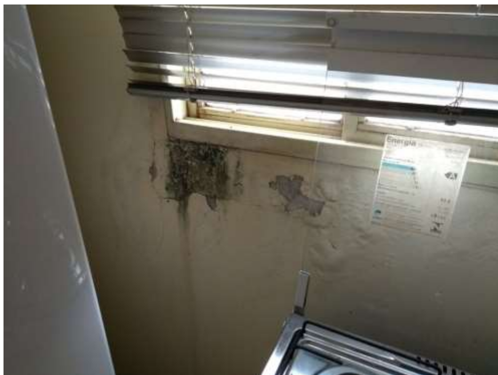
Figura 10 - Pintura 06