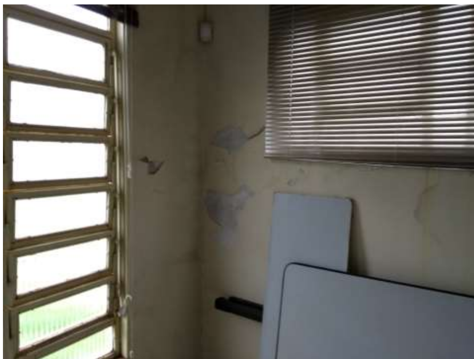
Figura 8 - Pintura 04