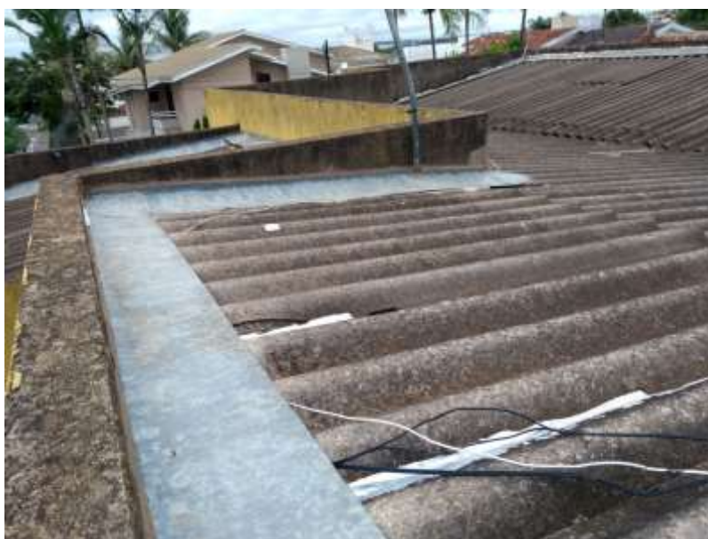
Figura 4 - Telhado 05