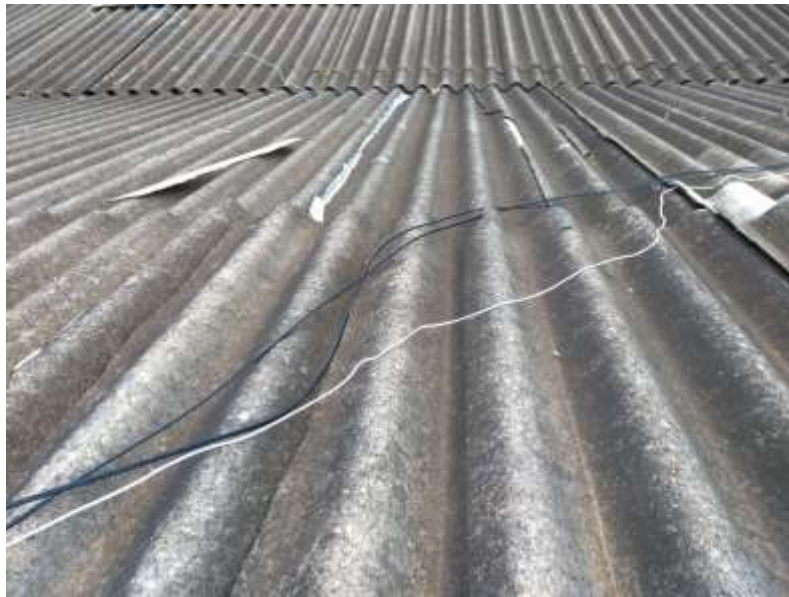
Figura 1 - Telhado 01