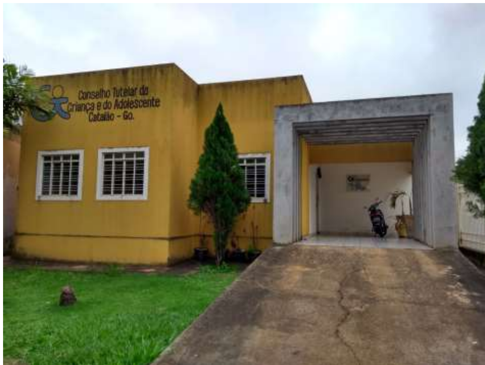
Figura 11 - Pintura 07