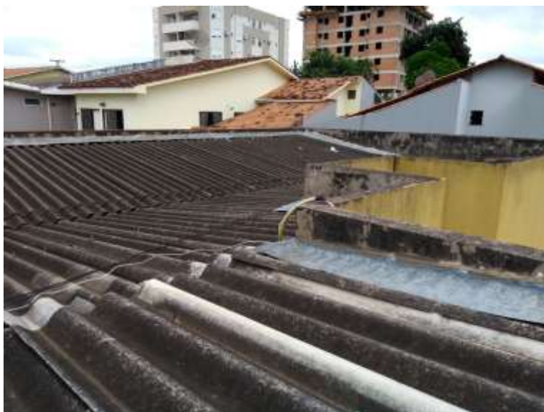
Figura 3 - Telhado 03