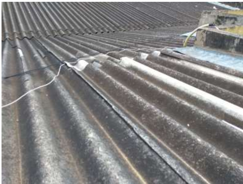
Figura 2 - Telhado 02