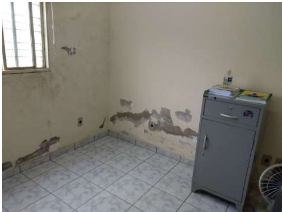
Figura 7 - Pintura 03