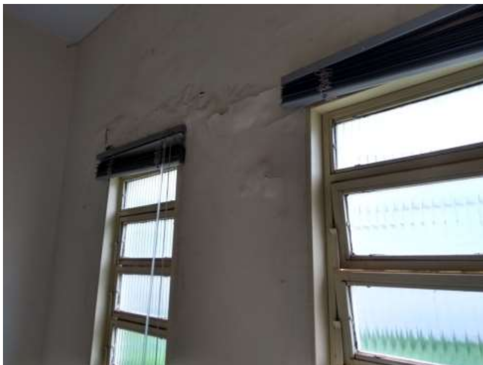
Figura 9 - Pintura 05