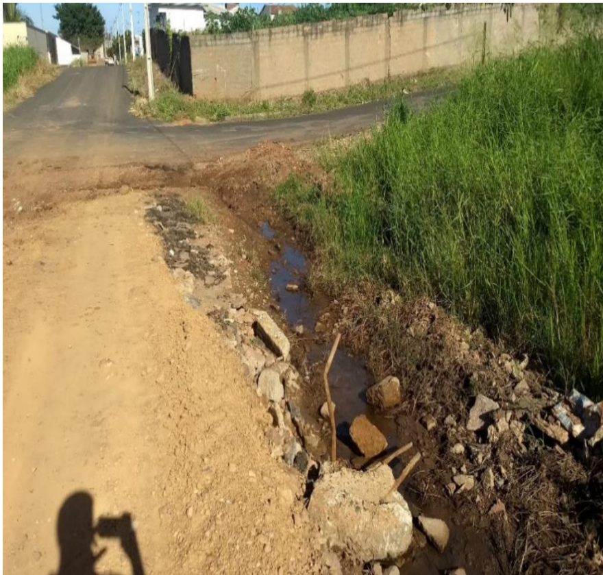
Foto 01 – vias sem dispositivos de drenagem pluvial e com presença de água.