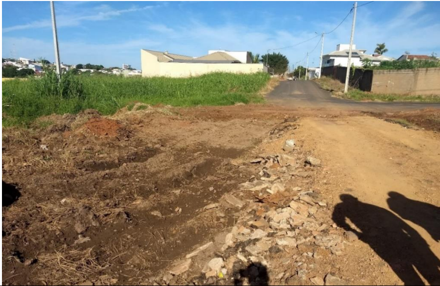
Foto 02 – solo úmido, com aspecto de alto teor de materia organica.

5.3. A aquisição das quantidades dos materiais listados acima atenderá à construção de: