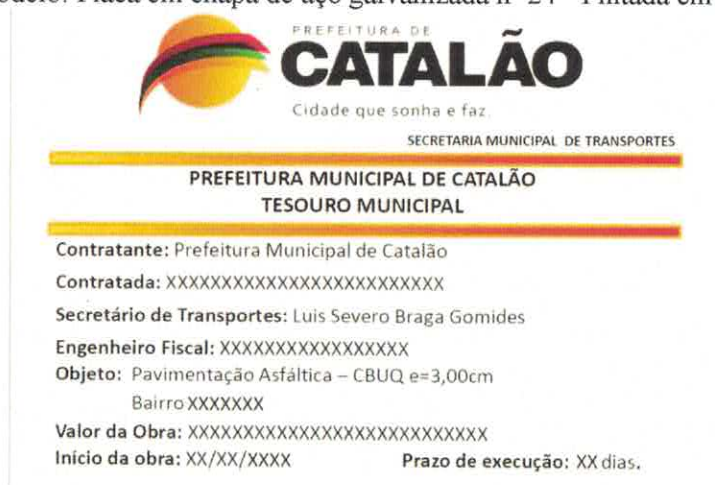
Figura 03 – Modelo: Placa em chapa de aço galvanizada nº 24 - Pintada em esmalte sintético

A placa deverá ser confeccionada em chapa de aço galvanizada nº 24, pintada em esmalte sintético e instalada em local visível definidos pela fiscalização. O modelo desta deverá ser solicitado junto à fiscalização, e estará sujeita à aprovação.