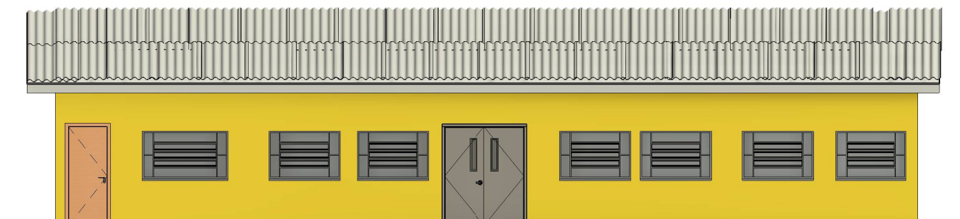
FACHADA FRONTAL ESCALA: 1:100