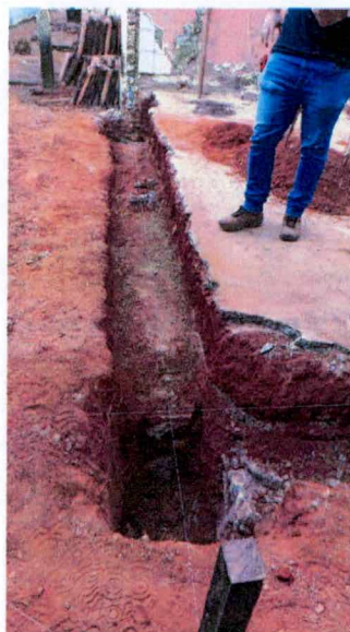
Foto 02: Escavação de valas para os baldrames das paredes do aditivo