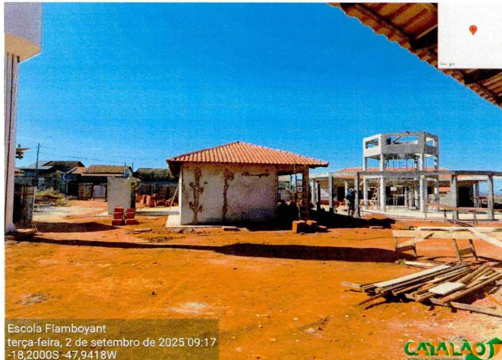
Foto 04: Telhamento do bloco de sala de aula finalizado e trama de madeira do pátio quase finalizada.