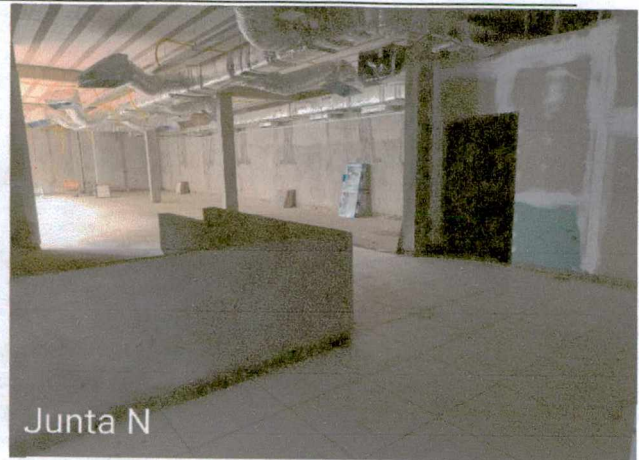
Fotos 28 a 29: 1º e 2º demão de massamento de paredes; execução de instalações elétricas; execução de instalações elétricas;