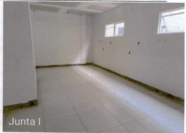
Fotos 17 a 18: Execução de instalações elétricas; execução de revestimento cerâmico; 1º e 2º demão de masseamento de paredes e teto;