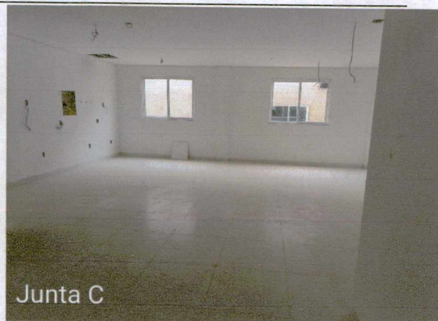
Fotos 5 a 6: Execução de revestimento cerâmico; 1° e 2° demão de masseamento de paredes e teto; execução de instalações de esgoto e pluvial externo; execução de instalações elétricas; instalação de equipamentos de ar condicionado;