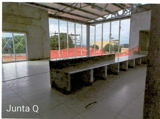
Fotos 34 a 35: Execução de revestimento cerâmico; 1º e 2º demão de masseamento de paredes; execução de instalações elétricas; montagem dos balcões em granito; montagem de esquadrias; montagem das telhas;