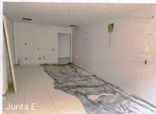
Fotos: 9 a 10: Execução de revestimento cerâmico; 1° e 2° demão de masseamento de paredes e teto; execução de instalações de esgoto e pluvial externo; execução de instalações elétricas; instalação de equipamentos de ar condicionado; instalação de esquadrias;