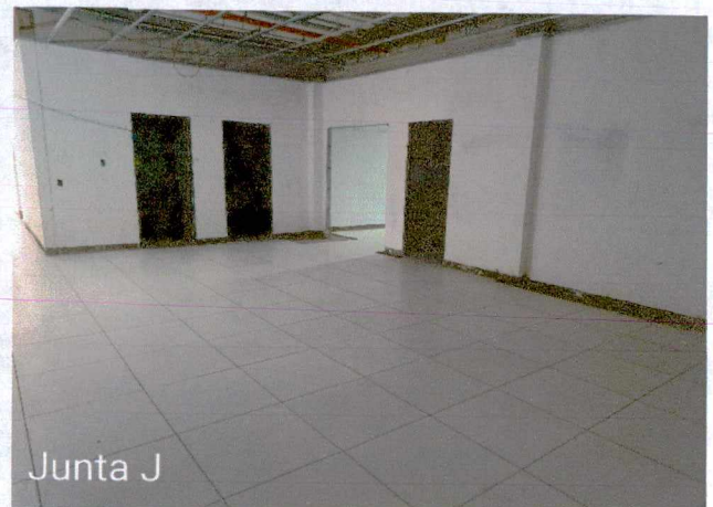
Fotos 19 a 20: Execução de revestimento cerâmico; 1º e 2º demão de maseamento de paredes e teto; execução de instalações elétricas;