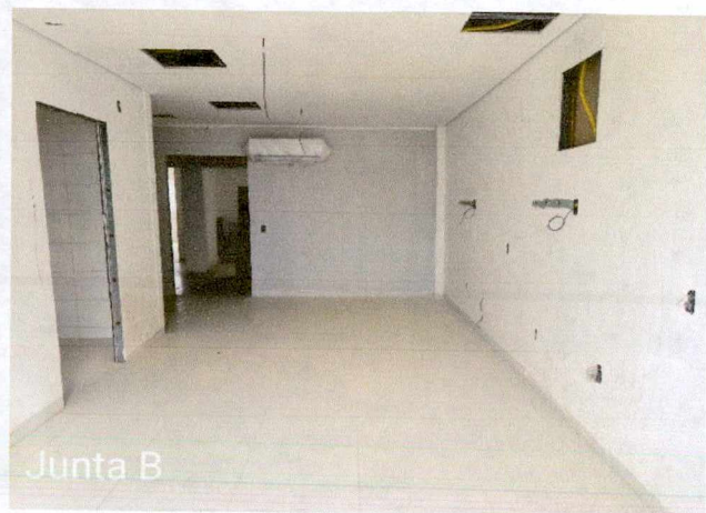
Fotos 3 a 4: Execução de revestimento cerâmico; instalações de equipamentos de ar condicionado; execução de instalações elétricas; instalação de esquadrias;