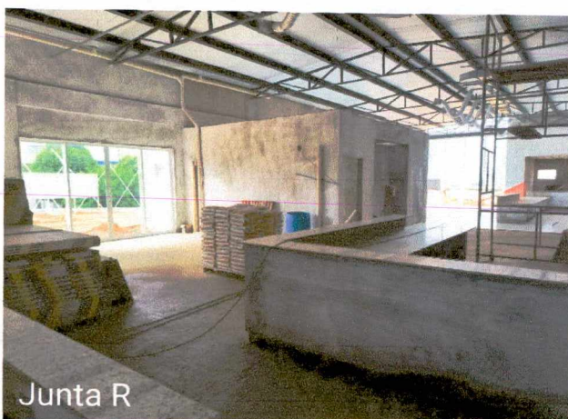
Fotos 36 a 37: Execução de revestimento cerâmico; 1º e 2º demão de masseamento de paredes; execução de instalações elétricas; montagem dos balcões em granito; montagem de esquadrias; montagem das telhas;