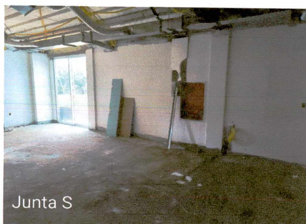
Foto 38 : 1º e 2º demão de masseamento de paredes; execução de instalações elétricas; montagem dos balcões em granito; montagem de esquadrias; execução de instalações de esgoto e pluvial externo;