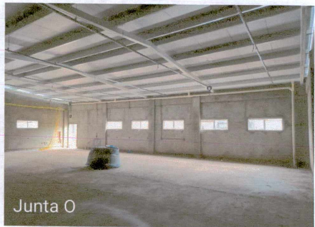
Fotos 30 a 31: Execução de revestimento cerâmico; montagem do drywall; 1º e 2º demão de massamento de paredes; execução de instalações elétricas; montagem das telhas; execução de instalações de esgoto e pluvial externo;