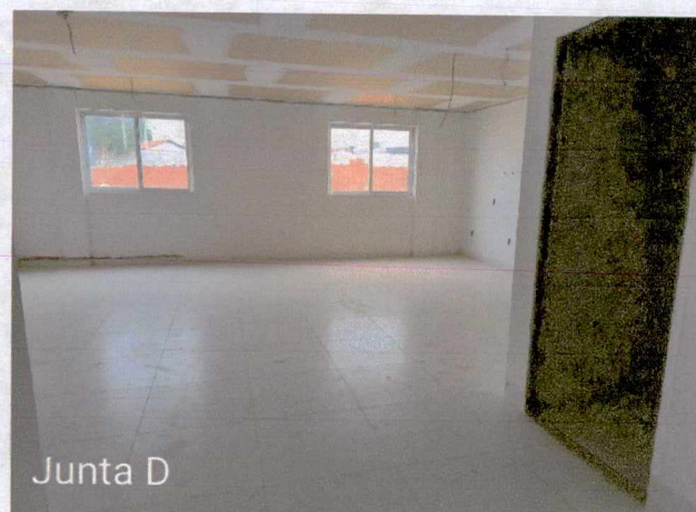
Fotos 7 a 8: Execução de instalações de esgoto e pluvial externo; execução de instalações elétricas; instalação de equipamentos de ar condicionado;