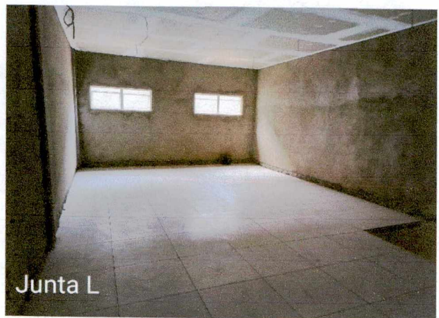
Fotos 23 a 24: 1º e 2º demão de masseamento de paredes; execução de revestimento cerâmico; instalação de esquadrias; execução de instalações de esgoto e pluvial externo;