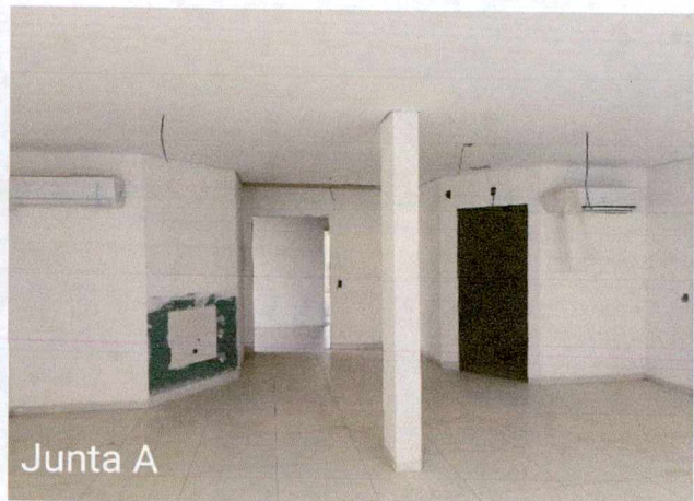
Fotos 1 a 2: Execução de revestimento cerâmico; execução de instalações de esgoto e pluvial externo; execução de instalações elétricas;