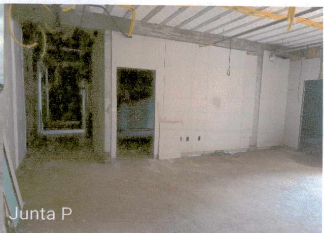
Fotos 32 a 33: Execução de revestimento cerâmico; 1º e 2º demão de massamento de paredes; execução de instalações elétricas; execução de instalações de esgoto e pluvial externo;