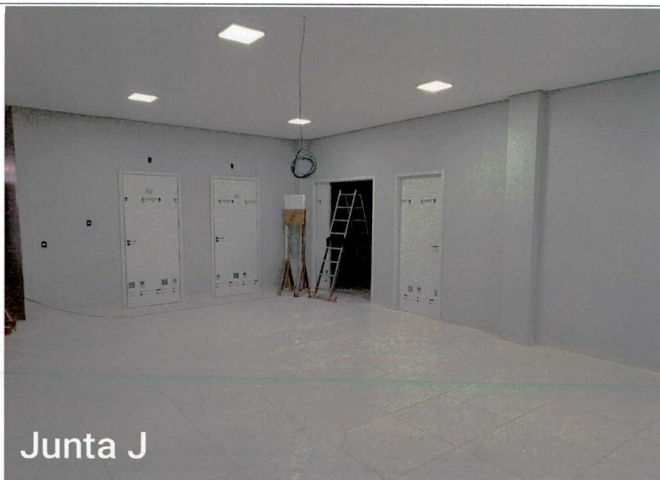
Fotos 12: Execução de pintura; instalação de luminárias; limpeza; instalação de bancadas;