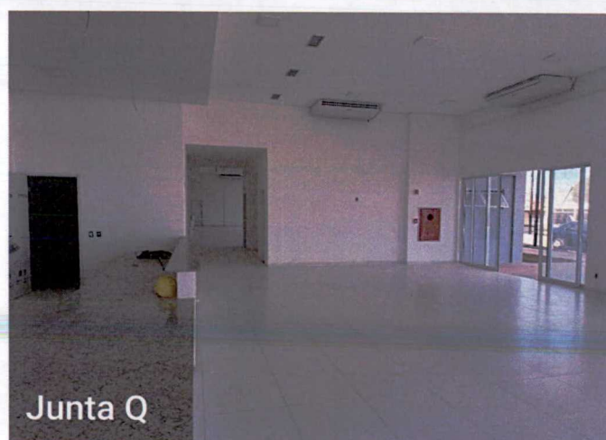
Fotos 16 a 18: Execução de pintura; instalação de luminárias; limpeza; instalação de bancadas;