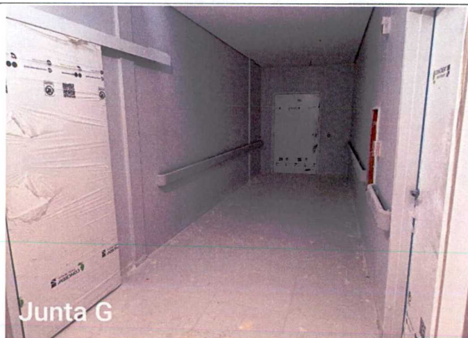
Fotos 5 a 7: Execução de pintura; instalação de luminárias; limpeza; instalação de metais e acabamentos; instalação de bate macas;