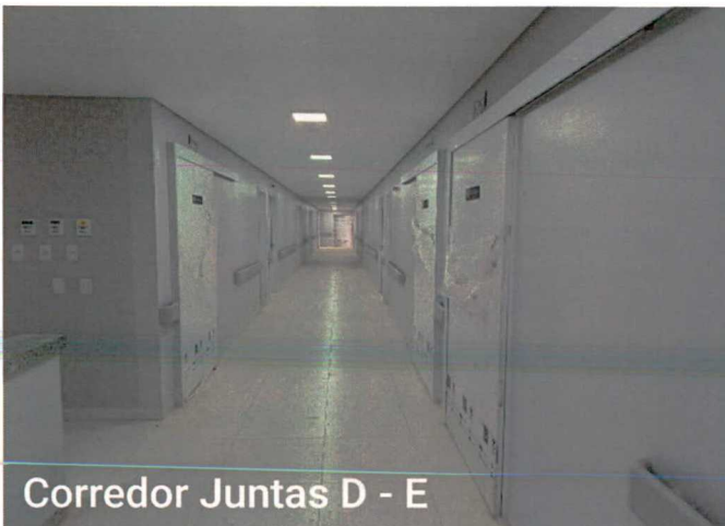
Corredor Juntas D - E

Fotos 1 e 2: Execução de pintura; instalação de luminárias; limpeza; instalação de metais e acabamentos; instalação de bate macas;