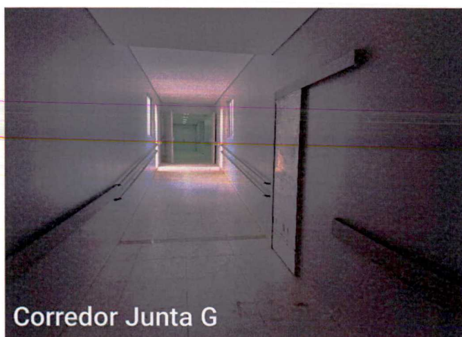
Corredor Junta G

Fotos 3 e 4: Execução de pintura; instalação de luminárias; limpeza; instalação de metais e acabamentos; instalação de bate macas;