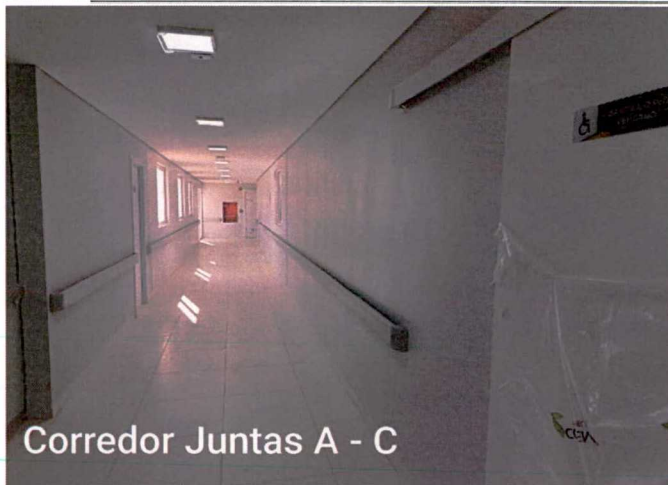
Corredor Juntas A - C