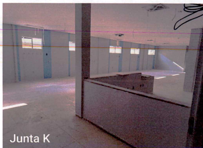
Fotos 13 a 15: Execução de pintura; instalação de luminárias; limpeza; instalação de bancadas;