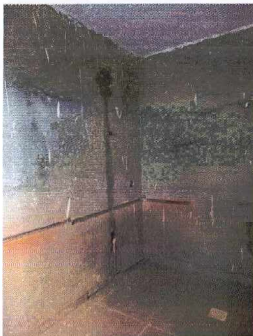
Fotos 03 e 04: Execução de reboco na alvenaria e emassamento da laje.