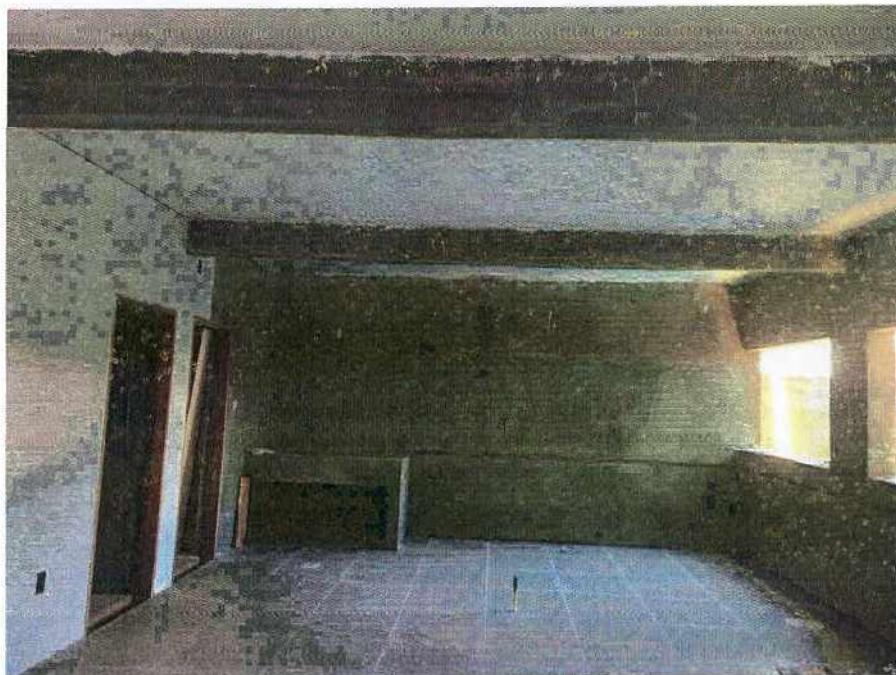
Foto 05: Tanque panelão e execução de revestimento na parede da cozinha.