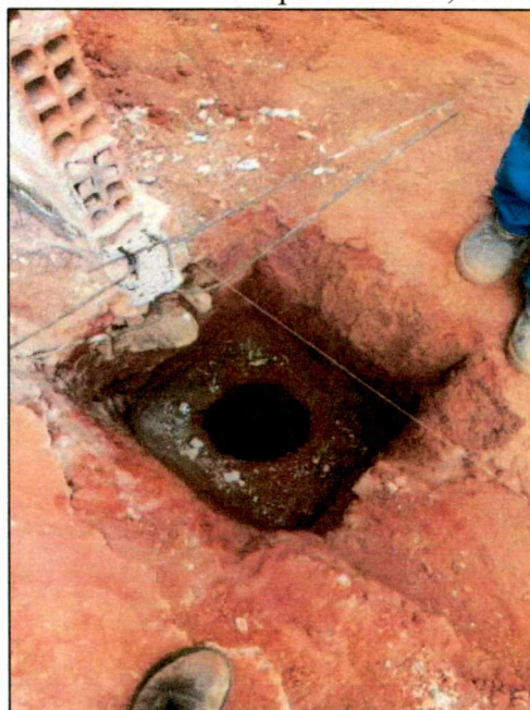
Foto 03: Escavação manual de valas para estacas, blocos e viga baldrame