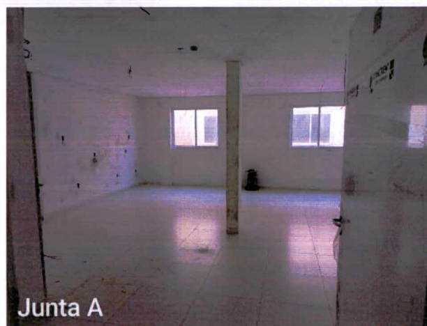
Fotos 1 a 3: Execução de acabamentos elétricos, de detecção e de incêndio; instalação de louças;