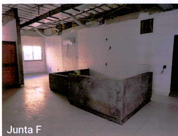
Fotos 15 a 17: Execução de acabamentos elétricos, de detecção e de incêndio; instalação de louças; instalação de portas de madeira;