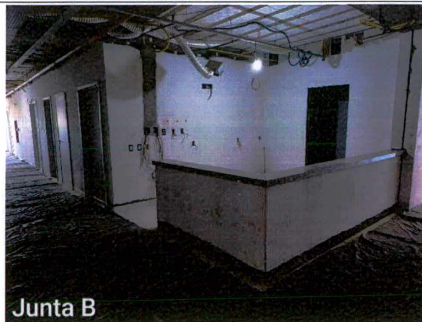
Fotos 4 a 6: Execução de acabamentos elétricos, de detecção e de incêndio; instalação de louças; assentamento de bancadas;