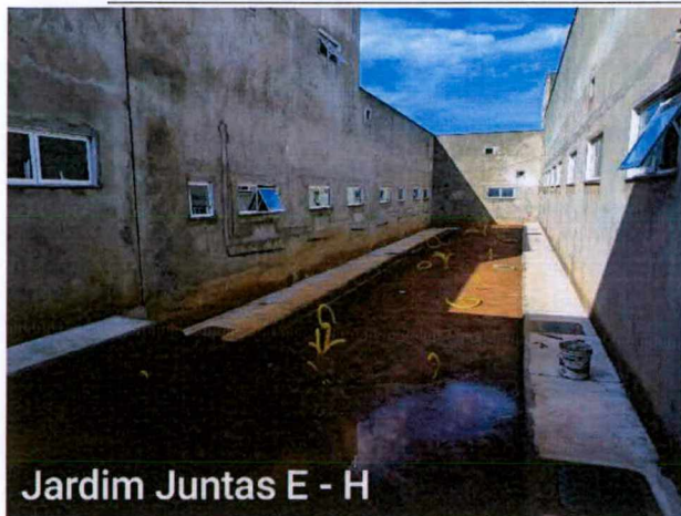
Jardim Juntas E - H