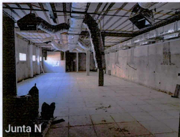
Fotos 27 a 28: Execução do revestimento cerâmico; montagem do ar condicionado dos centros cirúrgicos;