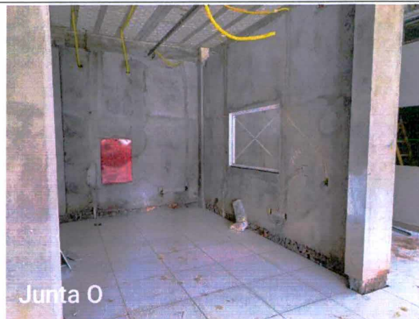
Fotos 29 a 31: Execução de revestimento cerâmico; montagem do Busway de ligação da subestação ao QGBT interno;