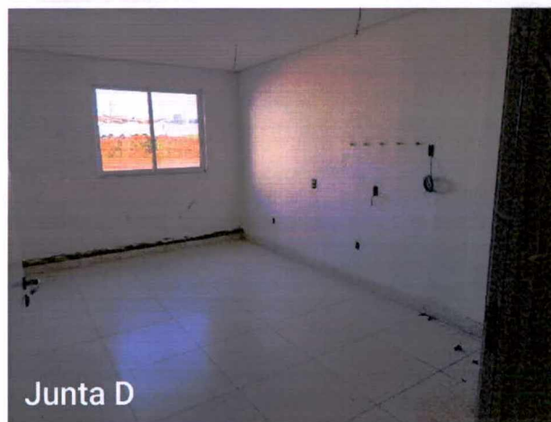
Fotos 10 a 12: Execução de acabamentos elétricos, de detecção e de incêndio; instalação de louças;