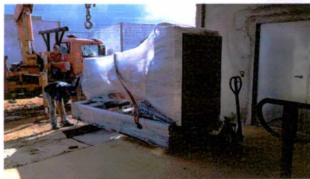
Fotos 41 a 44: Execução do contrapiso da subestação; regularização do contrapiso da subestação; montagem dos geradores;