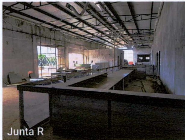
Fotos 37 a 38: Execução de revestimento cerâmico; execução de instalações elétricas;