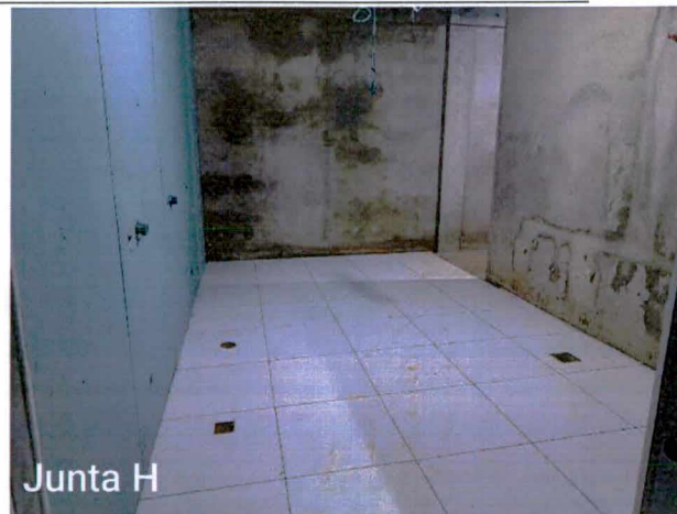
Fotos 20 a 21: Execução de revestimento cerâmico de piso e paredes;