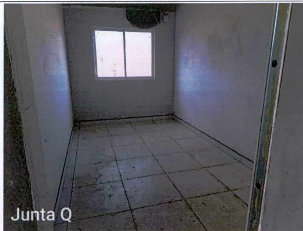
Fotos 34 a 36: Execução de revestimento cerâmico; execução de cordoalhas enterradas;