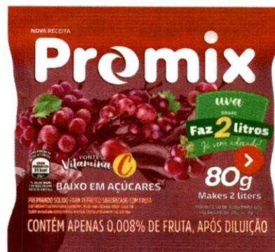
PROMIX 2L - 80g UVA