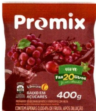
PROMIX 20L - 400g UVA