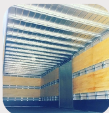
RODAPÉ (CHAPA DE AÇO) + COMPENSADO NAVAL LATERAIS E VERGALHÕES