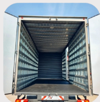
RIPAS GALVANIZADAS FUNDO (CHAPA DE AÇO) + VERGALHÕES