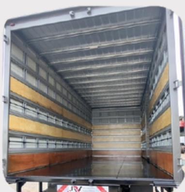
RIPAS GALVANIZADAS + MADEIRA