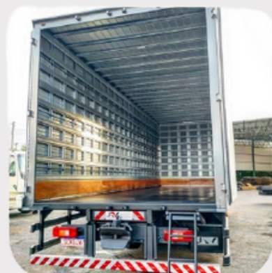
RODAPÉ (COMPENSADO NAVAL) + RIPAS GALVANIZADAS E VERGALHÕES