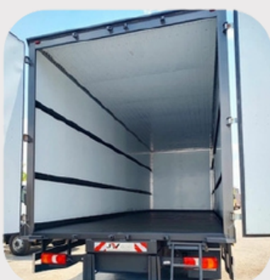
ISOLAMENTO TÉRMICO TOTAL (LATERAIS E TETO) + CARTOLAS DE AMARRAÇÃO