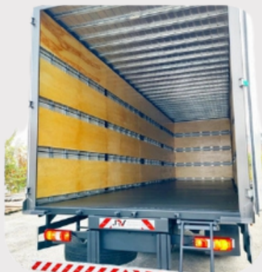
COMPENSADO NAVAL (LATERAIS) + VERGALHÕES