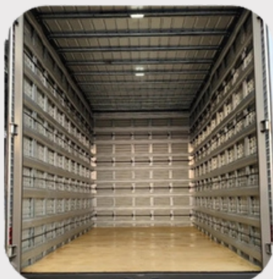
RIPAS GALVANIZADAS ASSOALHO (COMPENSADO NAVAL) + VERGALHÕES