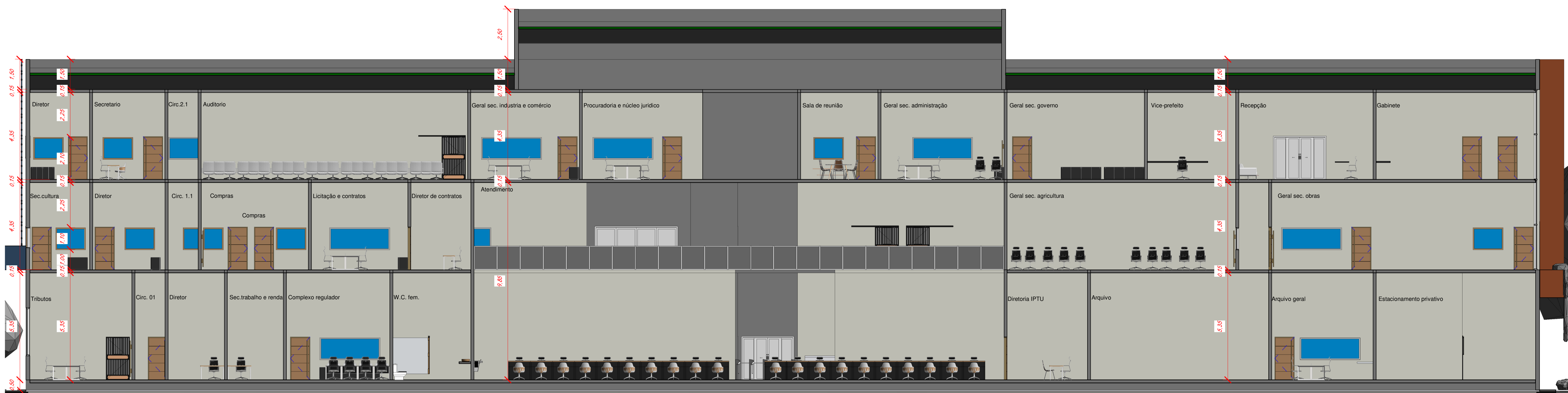
1 Corte A